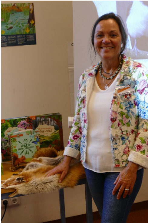
Bärbel Oftring: „Tatort Natur“